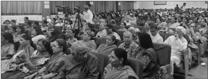
సభకు హాజరైన సాహిత్యాభిమానులు... రచయిత్రులు...