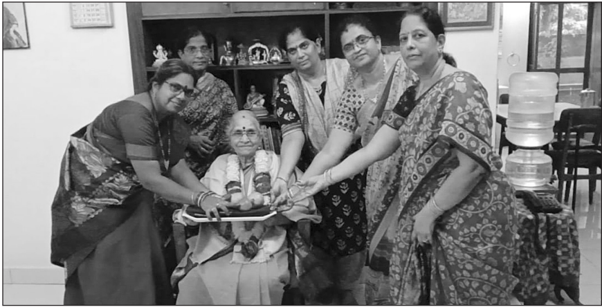
భమిడి కమలాదేవి (పల్నిమ గోదావరి)