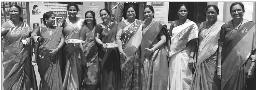
పురస్కార గ్రహీతల కోసం రిసెప్షన్ టీం ఎదురు చూపులు...