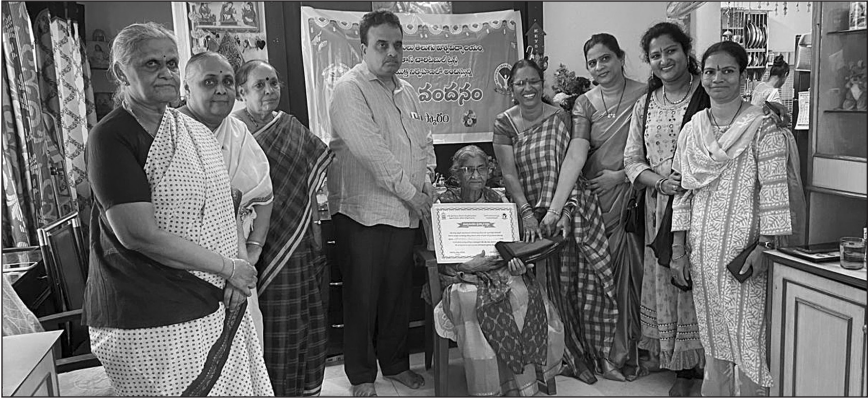
100 సంవత్సరాల తెన్నేటి మానిక్యాంబ