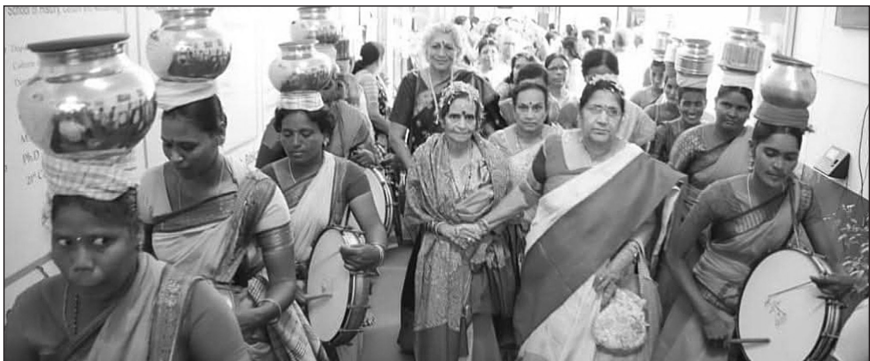
పురస్కార గ్రహీతలు స్వాగతాలు...