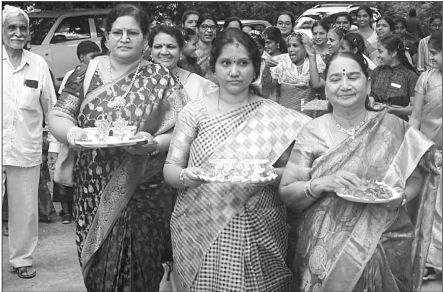
పురస్కార గ్రహీతలను స్వాగతిస్తూ...