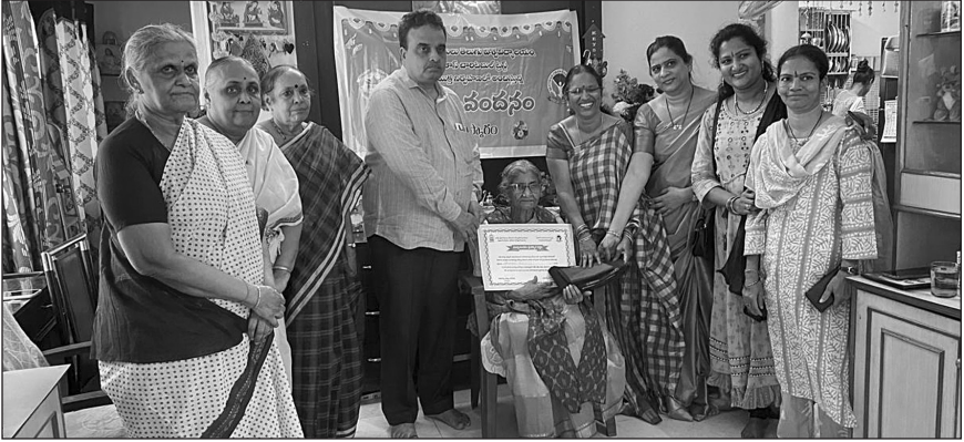
100 సంవత్సరాల తెన్నేటి మానిక్యాంబ