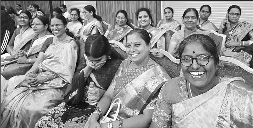
మాతృవందనం కార్యక్రమం సంబురారాల్లో...