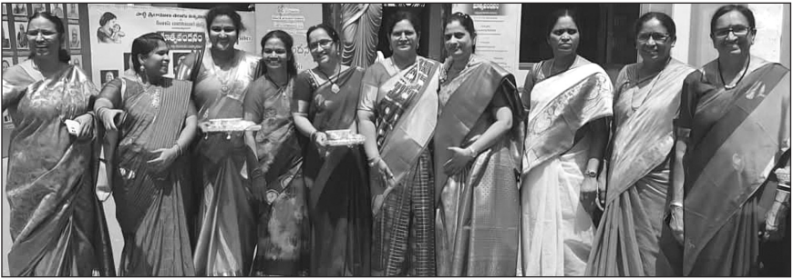
పురస్కార గ్రహీతల కోసం రిసెప్షన్ టీం ఎదురు చూపులు...