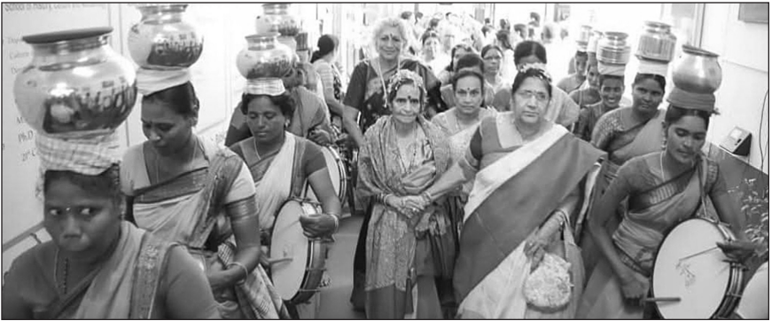
పురస్కార గ్రహీతలు స్వాగతాలు...