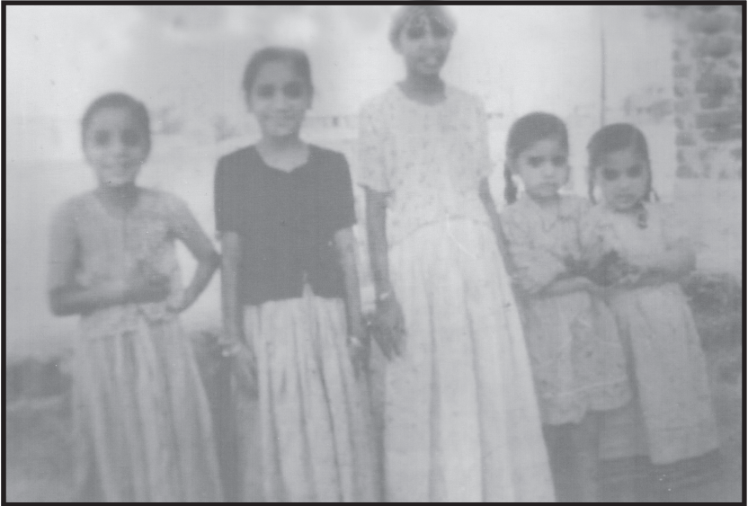
అక్కా, చెల్లెళ్లతో రచయిత్రి చిన్ననాటి ఫోటో

ఇప్పటి పిల్లలకి హాట్ ప్యాక్లు, చల్లనీళ్ల బాటిళ్లు, స్కూల్కి వెళ్లడానికి కార్లు, ఆటోలు ఇలా ఎన్నో సదుపాయాలు వున్నా, ఆనాటి ఉమ్మడి కుటుంబాలతో, చిన్న చిన్న అవసరాలకి కూడా, డబ్బు సమకూరక, సర్దుబాటు చేసుకుంటూ చిన్ని చిన్ని ఆనందాలు పొందుతూ, స్కూల్కి నడుచుకుంటూ వెళుతూ, దారిలో రేగుపళ్లు, పప్పుండలు కొనుక్కుని కాగి ఎంగిలి చేసుకుని, పంచుకుని తింటూ గడిపిన బాల్యంలోని మధురస్మృతుల ముందు దిగదుడుపే.