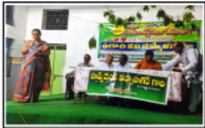
వెన్నెల సాహితీ సంగమం, సిద్దిపేట 'ఉగాది కవిసమ్మేళనం' సందర్భంగా