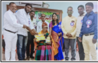
'తెలుగుతల్లి ఒడిలో' కథకు గాను తెలుగు వెలుగు వారిచే సన్మానం