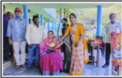
లద్దపేట హైస్కూల్ వారిచే 'తెలుగు భాషాదినోత్సవం' నాడు సన్మానం