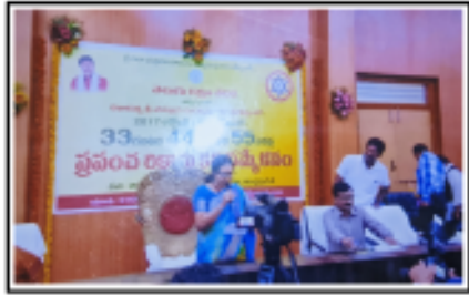
అనంతపురంలో జరిగిన 'ప్రపంచస్థాయి కవిసమ్మేళనం' సందర్భంగా