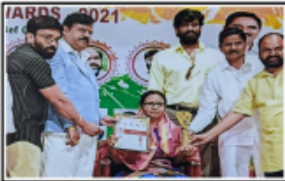
రవీంద్ర భారతిలో 'బుజ్జి ఫౌండేషన్( వారిచే సన్మానం సందర్భంగా