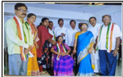
సాహిత్య పరిషత్ కవులచే సన్మానం