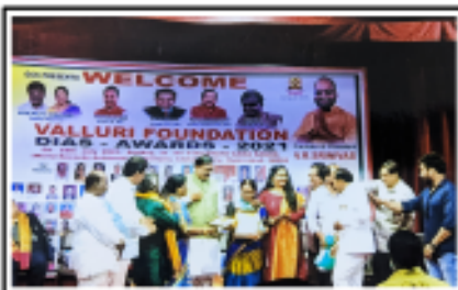
వల్లూరి ఫౌండేషన్ వారి త్యాగరాయ గానసభలో జీవితసాఫల్య పురస్కారం