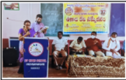
సిద్దిపేట 'విశ్వకర్మ ఉగాది కవి సమ్మేళనం' సందర్భంగా