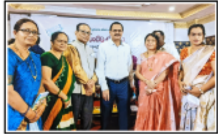
అనుబంధాల పూదోట పుస్తకావిష్కరణ సందర్భంగా 'బుర్ర బెంకట్టెం IAS గారితో