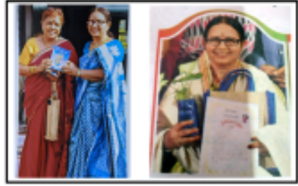
సురభి మెడికల్ కళాశాల (అనాటమి) ప్రొఫెసర్ గారికి పుస్తకం ఇస్తున్న సందర్భంగా