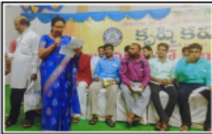
కరీంనగర్ లో జరిగిన 'కృషి కవిత సమ్మేళనం' సందర్భంగా