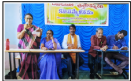
చీమ-ఉడుత పుస్తకావిష్కరణ, కవిసమ్మేళనంలో