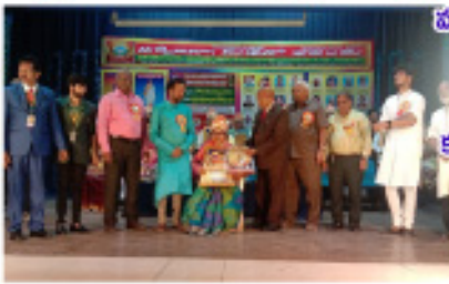
మల్లాలి ఫౌండేషన్ వారి 'మరో అమ్మ' కథకు గాను విశిష్ట ప్రతిభారత్న పురస్కారం అందజేశారు.