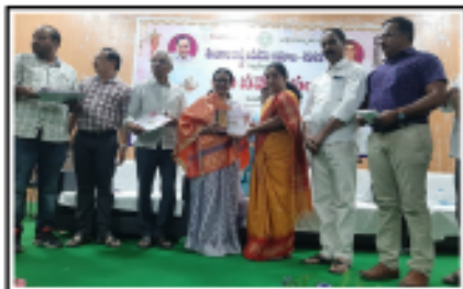
తెలంగాణ రాష్ట్ర అనంతరణ దినోత్సవం నాడు రోజూశర్మ గారి చేతుల మీదుగా సన్మానం