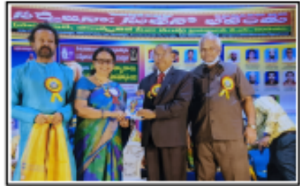
సర్వేజన సుఖినోభవంతు పురస్కారం సందర్భంగా జస్టిస్ చంద్రయ్య గారికి తన పుస్తకం అందిస్తూ